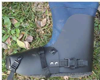
レイシールド/サイズ L