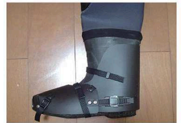
レイシールド/サイズ L