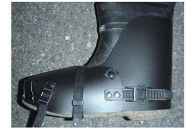
レイシールド/サイズ L

(アングラーズハウス・クロロブレン/P7バリア/PROXナイロン系他、ソールショルダー装着品)