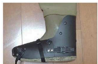
レイシールド/サイズ M