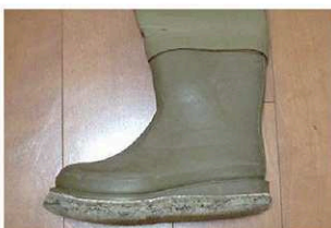
AH クロロブレン-M (ブーツ外周：約70.5cm)