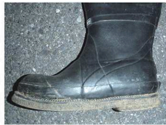
MZBF-092・旧ラバーブーツ-M (ブーツ外周：約70cm)