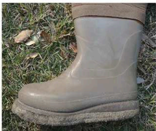
AH クロロブレン-L (ブーツ外周：約70.5cm)

ストッパープレート Set 例② ※出荷時は①の位置に取り付けています。スライドバックルは任意調節