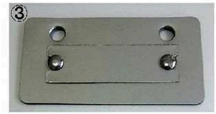
③ ①の状態より更に裾を深くしたい場合