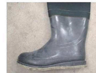
AH クロロブレン-L L (ブーツ外周：約71.5cm)