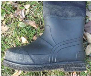
MZBF-092・MZBF-114-L L (ブーツ外周：約71.5cm)

ストッパープレート Set 例① ※出荷時はこの位置に取り付けています。 スライドバックルは任意調節