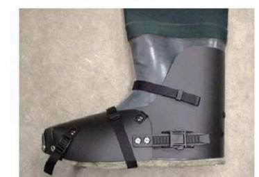
レイシールド/サイズ L