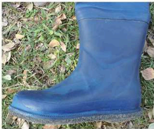
リバレイ/RBB-L L (ブーツ外周：約72cm)

ストッパープレート Set 例① ※出荷時はこの位置に取り付けています。 スライドバックルは任意調節