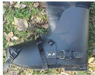
レイシールド/サイズ L