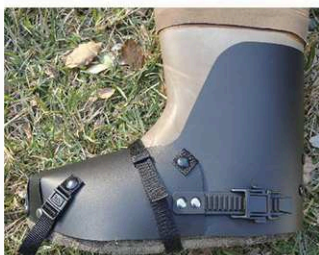
レイシールド/サイズ L