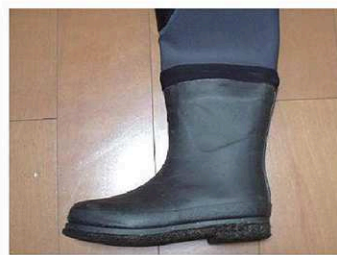
リバレイ/タイタニウム-L (ブーツ外周：約69.5cm)