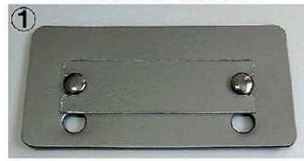
①マズメ・リバレイ等、キック高さ約3cm前着用