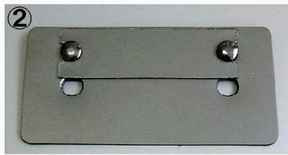
② アングラーズハウス等ソールショルダーへの取付用 高さを短くカットして、キックに合せた調節も出来ます。