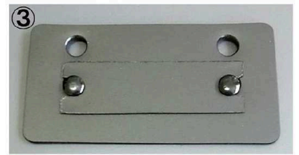
③ ①の状態より更に被りを深くしたい場合