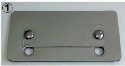
① マズメ・リバイ等、キック高さ約3cm前後用